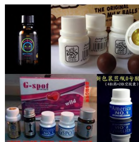
图3 “0号胶囊”的各种网购样品

其是同性恋者中流行，被商家制成胶囊或注射液通过互联网销售（见图3）。因多为男性同性恋者的女性角色（0号）所以又被称为“0号胶囊”“G点液”、犀牛液。商家对它的宣传：纯植物萃取精华，用于提高0号角色的局部快感和敏感神经。据研究5-MeO-DIPT通过选择性地影响5-羟色胺（5-HT）能系统产生中枢作用，使体温，皮质酮及行为产生改变，随之会产生迷幻现象，触觉、听觉、视觉发生扭曲；其他毒副作用包括瞳孔放大、恶心、下颚紧闭、肌肉紧张过度、高血压及心跳过速等症状。2006年报道了一名29岁男性因经肛门注入过量的“FOXY”溶液导致神经性中毒引发急性心力衰竭死亡的案例。因其潜藏之致命危险性，2015年列入我国非药用类麻醉药品和精神药品管制品种增补目录。另外因使用者很快出现迷幻现象，导致认知障碍，丧失防护意识，使用安全套及PrEP大幅降低，性病及HIV感染风险急剧增加。