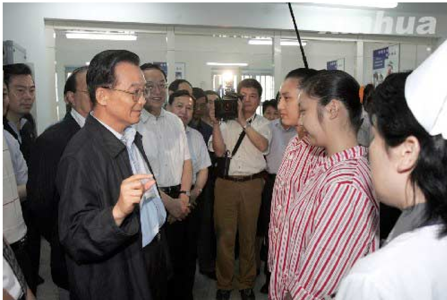
温家宝考察武汉戒毒所